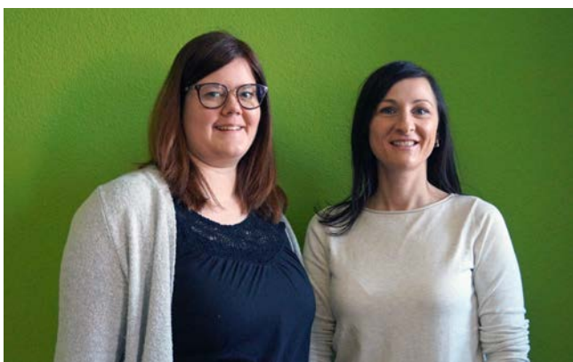
Das Team der Katholischen Jugendstelle

WAS UNSERE JUGENDPASTORAL KENNZEICHNET, SIND BEGEGNUNGEN, BEZIEHUNGEN, GEMEINSCHAFTSERFAHRUNGEN, KONTAKTE UND DIE ERFAHRUNG VON WECHSELSEITIGER ANERKENNUNG UND WERTSCHÄTZUNG. DAHER IST UNSERE JUGENDPASTORAL AUFGEBAUT AUF DEM GRUNDPRINZIP DES PERSONALEN ANGEBOTS.