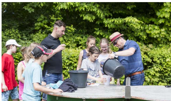
Beim Stationenlauf mussten zusammen Aufgaben gemeistert werden