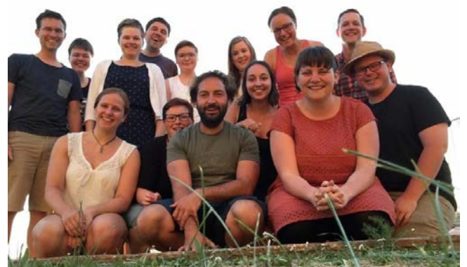
Strahlende Gesichter - die TeilnehmerInnen der Fahrt