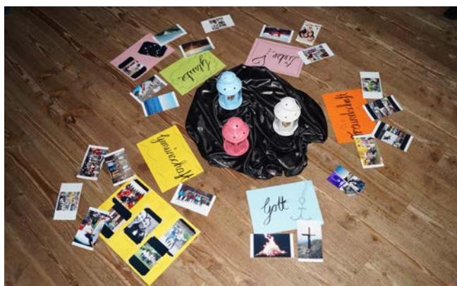
Sich mit dem eigenen Glauben auseinandersetzen