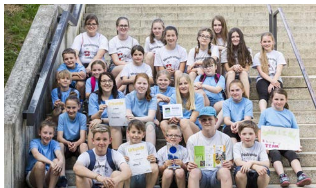
Die Sieger durften sich über tolle Preise freuen