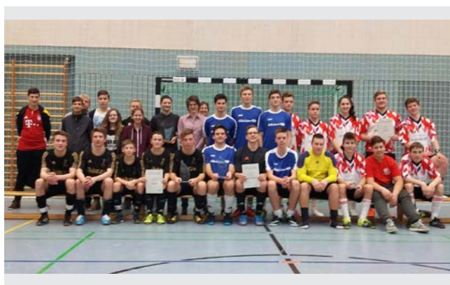
Die Siegerteams der Senioren