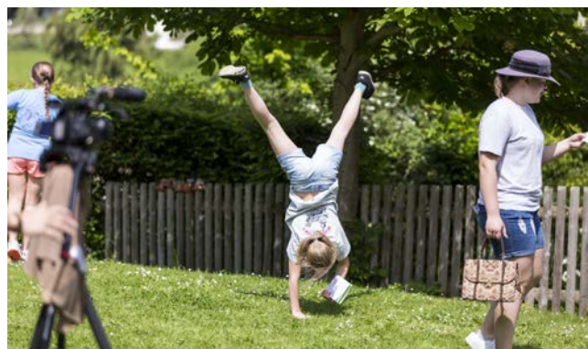
Beim Theaterworkshop konnten einige ihr Talent unter Beweis stellen