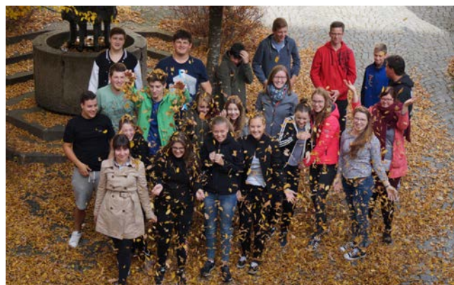
Spaß haben :)