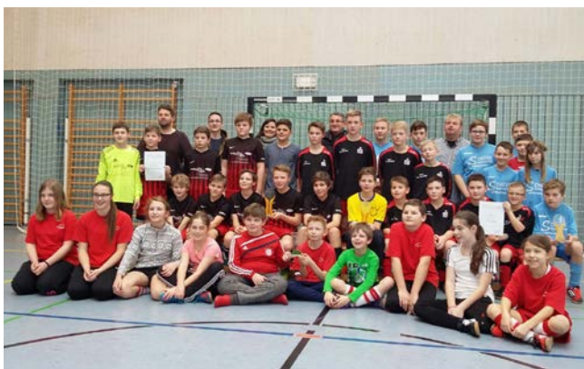
Die drei besten Mannschaften der Junioren