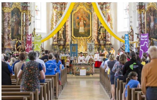
Gemeinsam wurde ein festlicher Gottesdienst gefeiert