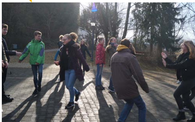
Neue Spiele selbst testen