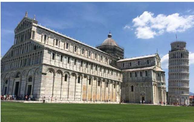
Neben viel Zeit für sich stand natürlich auch Sightseeing auf dem Programm