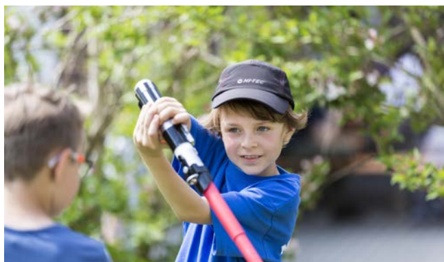
Auch Jedi wurden ausgebildet