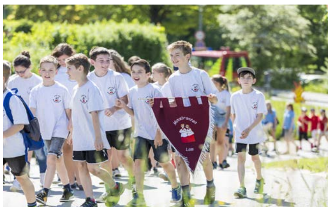
Mit Wimpel und Fahnen wurde in die Kirche eingezogen